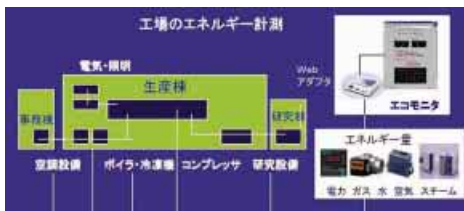
省エネルギーモニタリングシステム

下水処理においては、独自開発の予測・推定技術である位相事例ベースモデリング技術TCBM(Topological Case Based Modeling)により、処理場に流れ込む水量変化の予測情報を提供していきます。