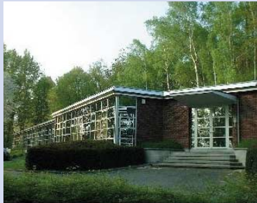
山武ヨーロッパ本社外観